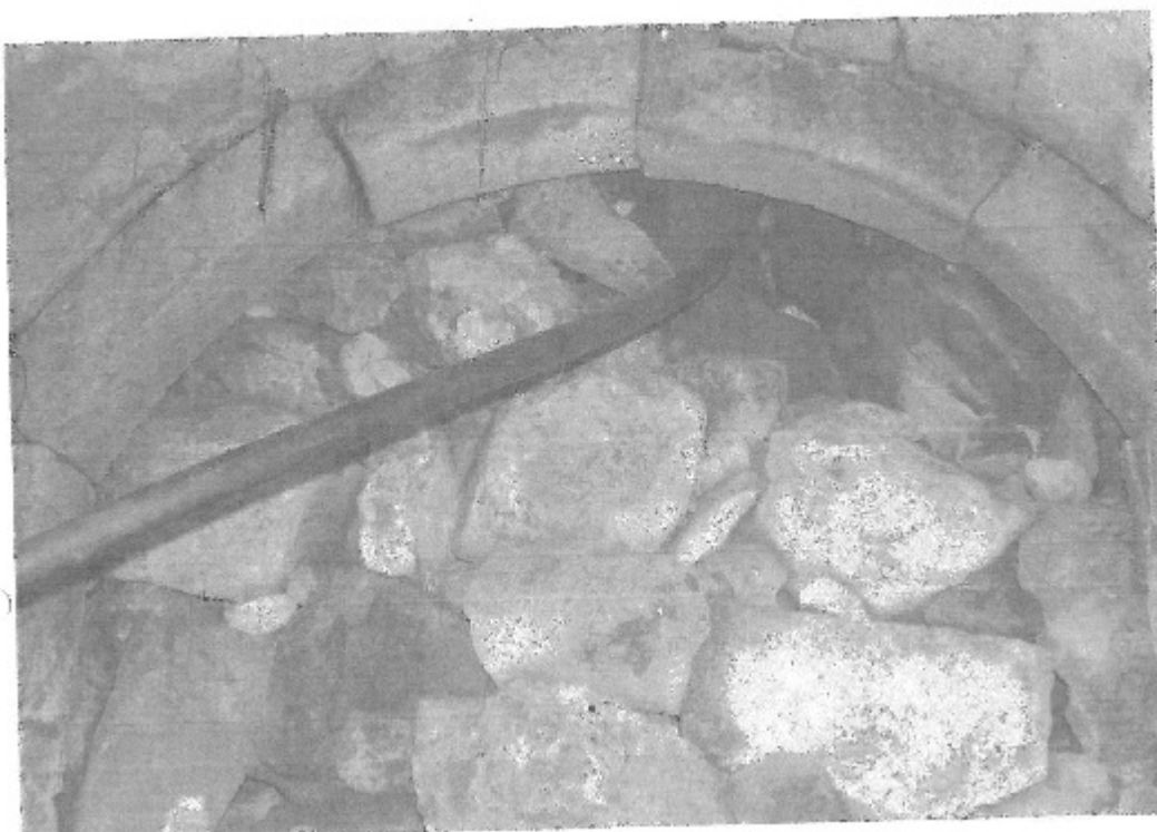
Belle voûte souillée par l'adduction d'eau