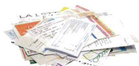
COURRIERS ET PAPIERS DE BUREAUX