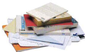
AUTRES PAPIERS (livres de poche, carnets)