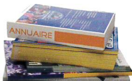
CATALOGUES ET ANNUAIRES