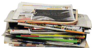
JOURNAUX ET MAGAZINES