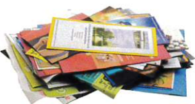
PUBLICITÉS ET PROSPECTUS