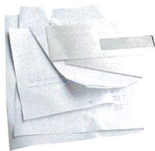
ENVELOPPES, ENVELOPPES À FENÊTRES